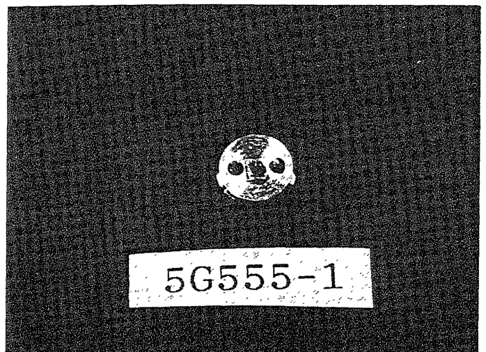
Fig.2 A Ge:Ga far-infrared photoconductor with 0.5 mm cube for space astronomy mounted on a Cu-plate.