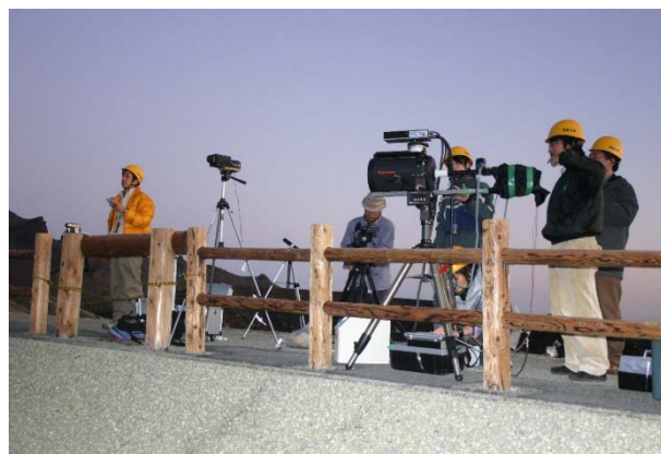
Figure 1. Observation with the portable water vapor Raman Lidar developed by RISH, Kyoto University at Nakadake crater, Mt. Aso.

Fig.2に鉛直スキャンの観測結果の一例として、2009年10月15日20:33-20:52に実施した鉛直スキャン1回目の結果を示す。各方向での積分時間は3分、方位角36.1度、俯角28度から上方へ7度ずつ変えて計5方向の計測を行った。その時の気象条件は、気温12.9度、湿度42%、気圧894hPa、6m/sの南風であった。壁の近くの湯だまりの湖面付近〔(水平距離, 高度)=(290,-100)〕に水蒸気混合比の約4.4g/kgの大きな増加が見られる。また、同じ領域において後方散乱比に12.6~25.1倍程度の増加があり相関が見られる。鉛直スキャン2回目（より噴気口から遠い断面）における鉛直断面の計測結果でも鉛直スキャン1回目の計測結果と同様に湖面付近で水蒸気の増加が見られた。しかし、この湖面付近の増加は1.8-2.2g/kgと小さく、同じ位置で後方散乱比の顕著な増加は見られない。このため、鉛直スキャン2回目で捉えた湖面付近の水蒸気の増加は火口湖からの蒸発が支配的であると考えられる。また、先述した2つの鉛直スキャンの結果より、鉛直スキャン1回目で捉えた湖面付近の約4.4g/kgの増加は、噴気と湖面蒸発の水蒸気の量比が約1:1であることが推定される。このように複数の断面の計測結果を合わせる事で、火口内の噴気口からの水蒸気と火口湖からの水蒸気を分離して見積り可能である事が示唆されたことの意義は大きい。