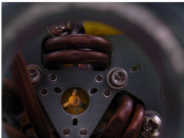
Fig.1 Laser rod pumped from three directions

情報通信研究機構(NICT)では二酸化炭素観測と風分布観測のためのライダー技術の研究開発を行っている。その中では2 \mu m レーザを使い、ヘテロダイン検波によるドップラーライダーや差分吸収ライダー (DIAL) を開発することになっている。2 \mu m レーザでは100mJ (20Hz) で発振するLD 励起の伝導冷却レーザーや、460mJ 出力 (10Hz) のアンプを開発してきた。しかし、これらのレーザーは大出力向きであり、地上観測や車載等を考えたときにはより小型のレーザーで十分である。ここでは最近開発を進めている、中程度出力のレーザー開発について紹介を行う。これらのレーザーはCO 2 観測や風観測に実際に使われ始めている。